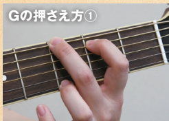
Gの押さえ方① ▲最初はこの押さえ方が簡単。人差指で5弦2フレット、中指で6弦3フレット、薬指で1弦3フレットを押さえる。

▲ 3拍子の、いわゆるワルツのリズム。6・8小節目以外は1拍ずつダウンピッキング(6弦側から1弦側に振り下ろすストローク)で、ピックに慣れない人は親指でOK。コードは3つとも3本の指で押さえられるので比較的カンタンですが、コードチェンジの際は3本の指とも押さえるポジションが変わるので、頭と体が覚えるまで根気よく!