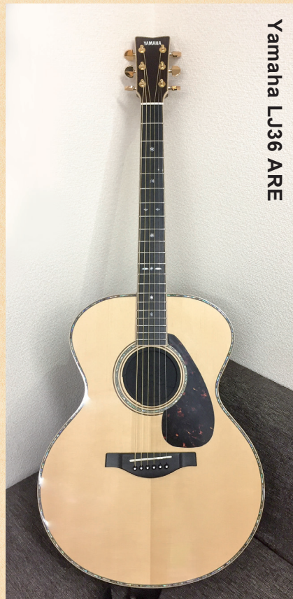
Yamaha LJ36 ARE

◀ヤマハ独自の木材改質技術「A.R.E.」を採用することで音の伝達と振動効率を上げ、熟成された味わい深い響きを獲得。ミニディアムジャンボボディで、抜群のレスポンスを備えている。