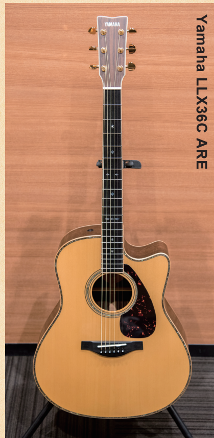
Yamaha LLX36C ARE

◀ヤマハが独自に研究・開発した木材改質技術「ARE」を採用。ピックアップ&ブリアンブはシステム60Ⅱで、ブリッジ付近に仕込まれた3つのピックアップによって緻密な音作りが可能となっている。