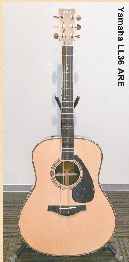
Yamaha LL36 ARE

◀オリジナルのジャンボボディで、ヤマハ独自の木材改質技術「A.R.E.」を採用することで音の伝達と振動効率を上げ、熟成された味わい深い響きを獲得。ネックは高い演奏性を実現する新形状を採用している。