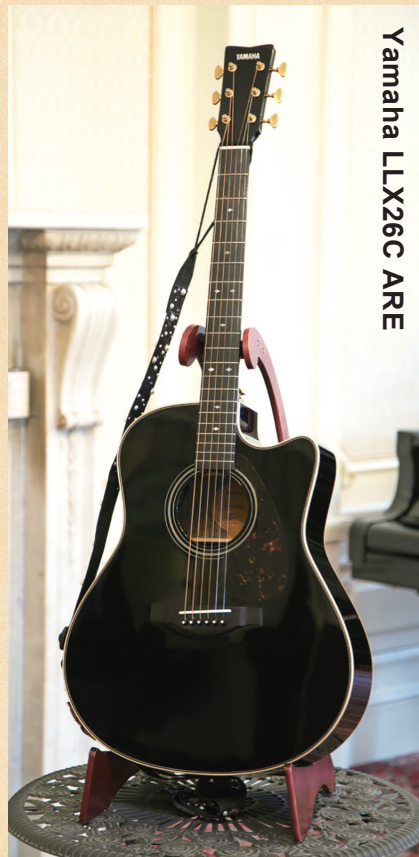
Yamaha LLX26C ARE

◀ヤマハが独自に研究・開発した木材改質技術「A.R.E.」を採用。ピックアップシステムはシステム60Ⅱで、ブリッジ付近に仕込まれた3つのピックアップによって緻密な音作りが可能となっている。カラーはブラック。