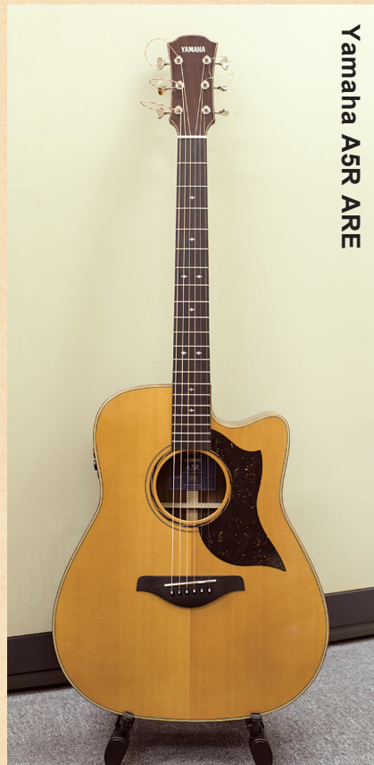
Yamaha A5R ARE

◀ヤマハ独自の木材改質技術「A.R.E.」を採用することで音の伝達と振動効率を上げ、熟成された味わい深い響きを獲得。SRT2ピックアップアップにより、ダイナミックで温かみのある音を実現。