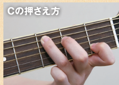
Cの押さえ方 ▲人差指で2弦1フレット、中指で4弦2フレット、薬指で5弦3フレットを押さえる。6弦は鳴らさなくてもOK。