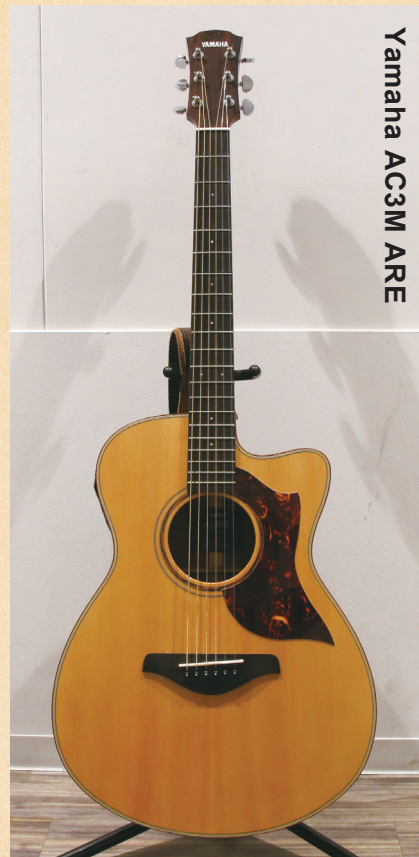
Yamaha AC3M ARE

◀ヤマハ独自の木材改質技術「A.R.E」を採用することで音の伝達と振動効率を上げ、熟成された味わい深い響きを獲得。S.R.T.2ピックアップアップシステムの搭載により、ピエゾとマイクサウンドのブレンド具合を調節可能。