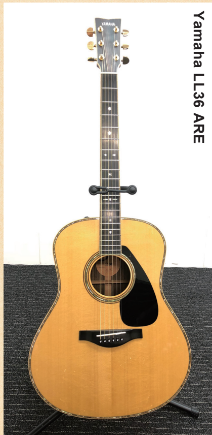
Yamaha LL36 ARE

◀オリジナルのジャンボボディで、ヤマハ独自の木材改質技術「A.R.E.」を採用することで音の伝達と振動効率を上げ、熟成された味わい深い響きを獲得。ネックは高い演奏性を実現する新形状を採用している。