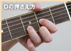
Dの押さえ方 ▲人差指で3弦2フレット、中指で1弦2フレット、薬指で2弦3フレットを押さえる。6弦は鳴らさない。