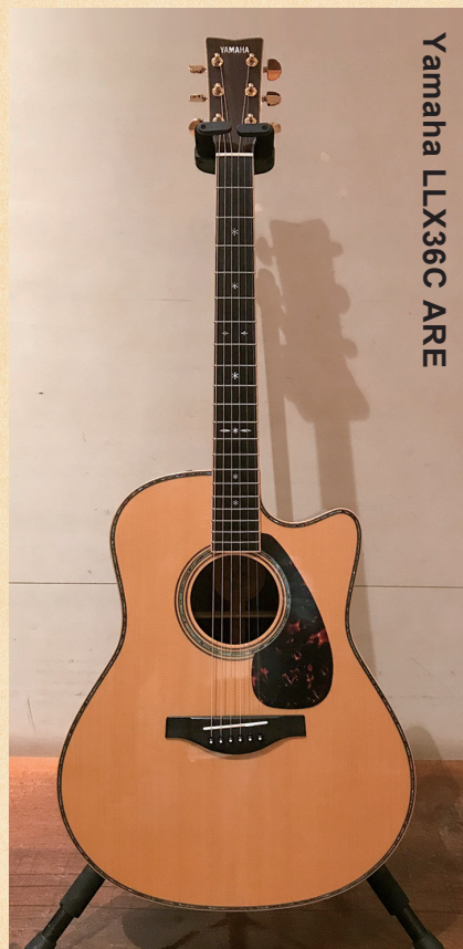
Yamaha LLX36C ARE

◀ヤマハが独自に研究・開発した木材改質技術「A・R・E」を採用。ピックアップ&プリアンプはシステム60IIで、ブリッジ付近に仕込まれた3つのピックアップアップによって緻密な音作りが可能となっている。