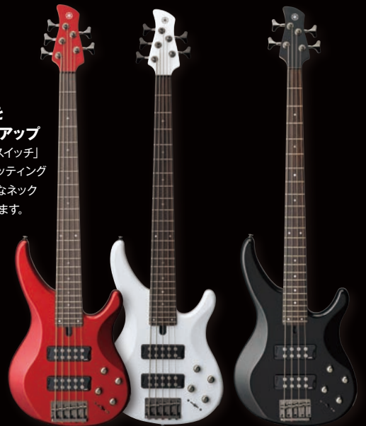
TRBX305 CAR (キャンディアップルレッド)