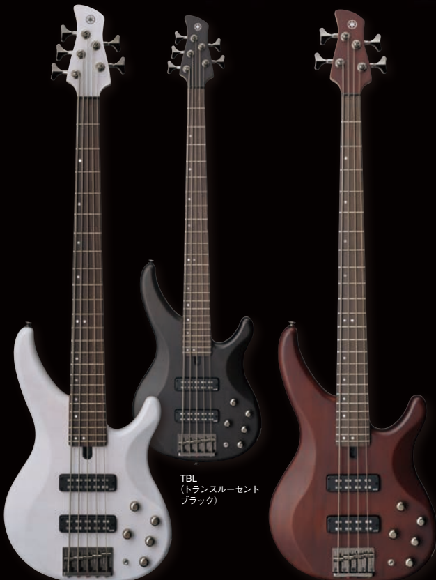
TBL (トランスルーセント ブラック)

5段階の「パフォーマンス EQ スイッチ」 により、奏法に最適なトーンセッティング に瞬時に切り替え可能。スリムなネック とボディが抜群の演奏性を誇ります。