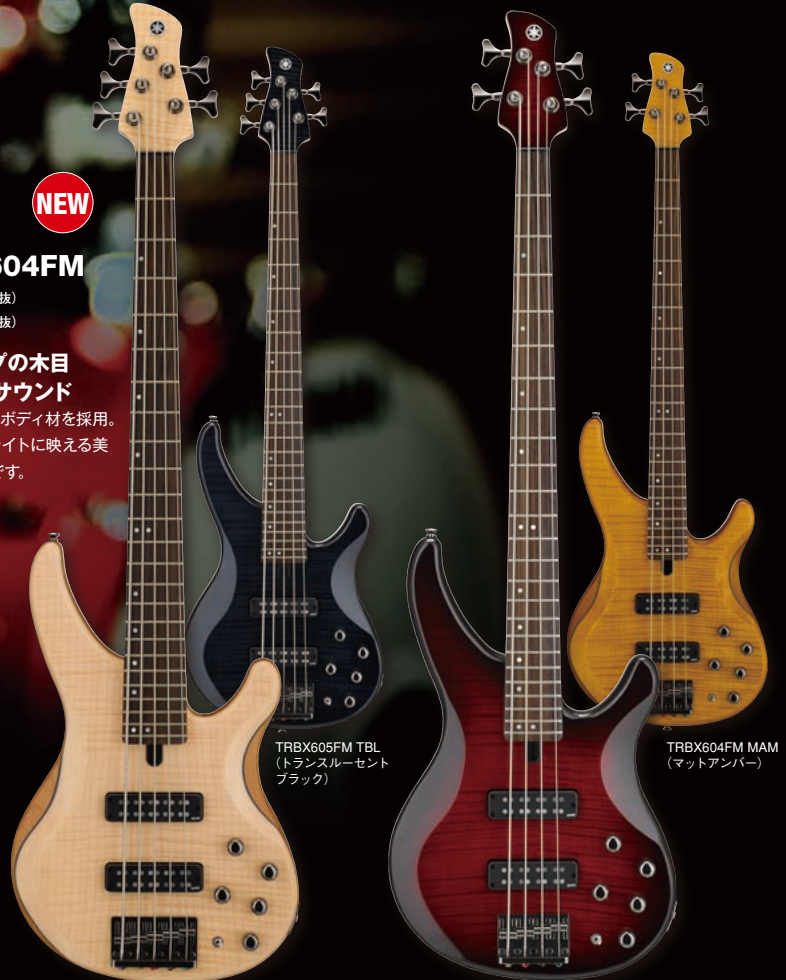
TRBX605FM TBL (トランスルーセント ブラック)

フレームメイプル+アルダーのボディ材を採用。 バランスの取れたサウンドとライトに映える美しいルックスを備えたモデルです。