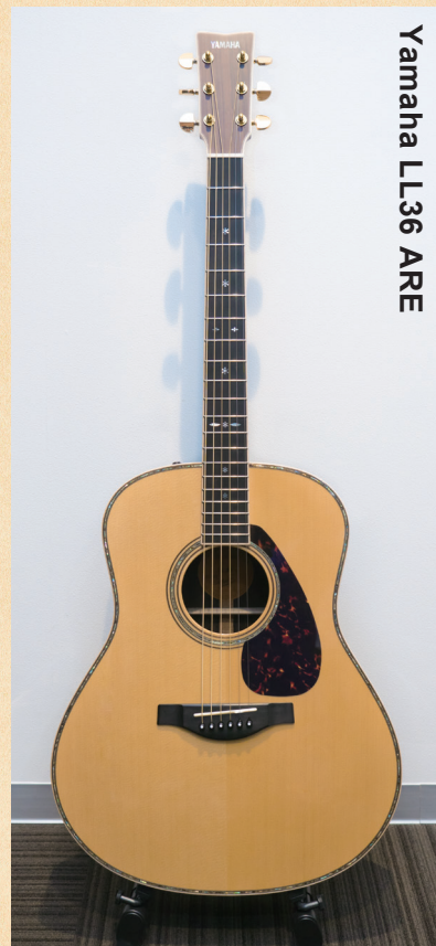
Yamaha LL36 ARE

◀ オリジナルのジャンボボディで、ヤマハ独自の木材改質技術「A.R.E.」を採用することで音の伝達と振動効率が上げ、熟成された味わい深い響きを獲得。ネックは高い演奏性を実現する新形状。ピックアップはシステム 60 を後付けしている。