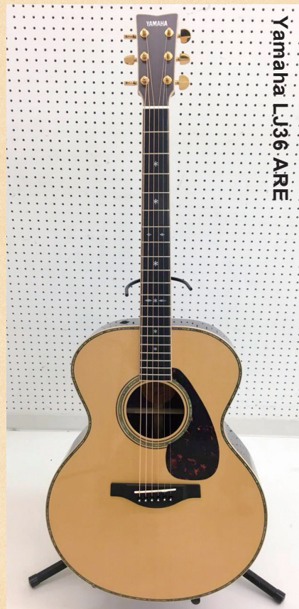
Yamaha LJ36 ARE

◀ヤマハ独自の木材改質技術「A.R.E.」を採用することで音の伝達と振動効率を上げ、熟成された味わい深い響きを獲得。ミディアムジャンボボディで、抜群のレスポンスを備えている。