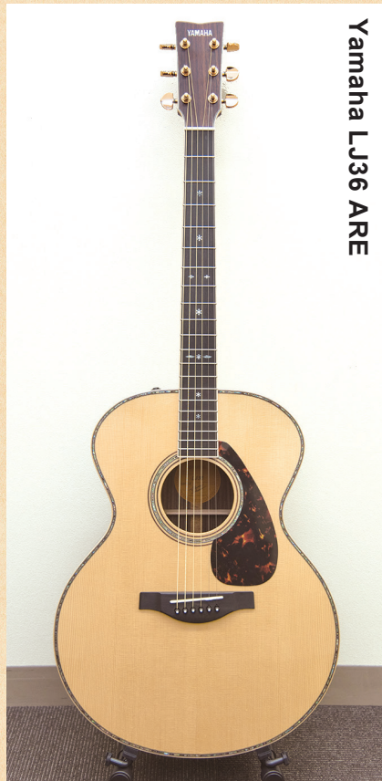
Yamaha LJ36 ARE

◀ヤマハ独自の木材改質技術「A.R.E.」を採用することで音の伝達と振動効率を上げ、熟成された味わい深い響きを獲得。ミディアムジャンプボディで、抜群のレスポンスを備えている。