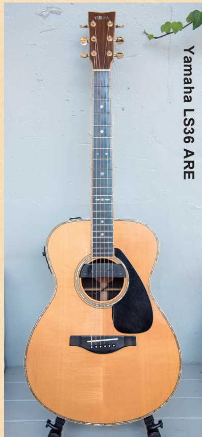
Yamaha LS36 ARE

◀オリジナルのスマールボディで、独自の木材改質技術「A.R.E.」を採用することで音の伝達と振動効率を上げ、熟成された味わい深い響きを獲得。ネックは高い演奏性を実現する新形状。マグネティックタイプのピックアップを後付けしている。