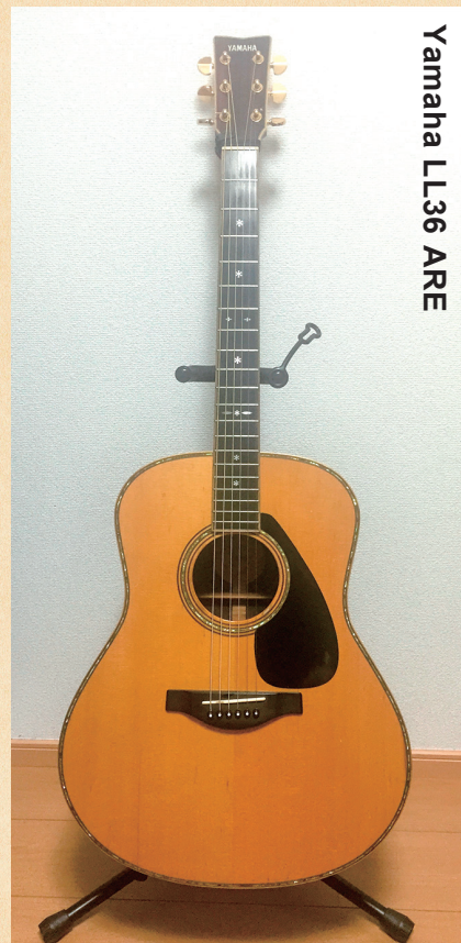
Yamaha LL36 ARE

◀オリジナルのジャンボボディで、ヤマハ独自の木材改質技術「A.R.E.」を採用することで音の伝達と振動効率を上げ、熟成された味わい響きを獲得。ネックは高い演奏性を実現する新形状を採用している。