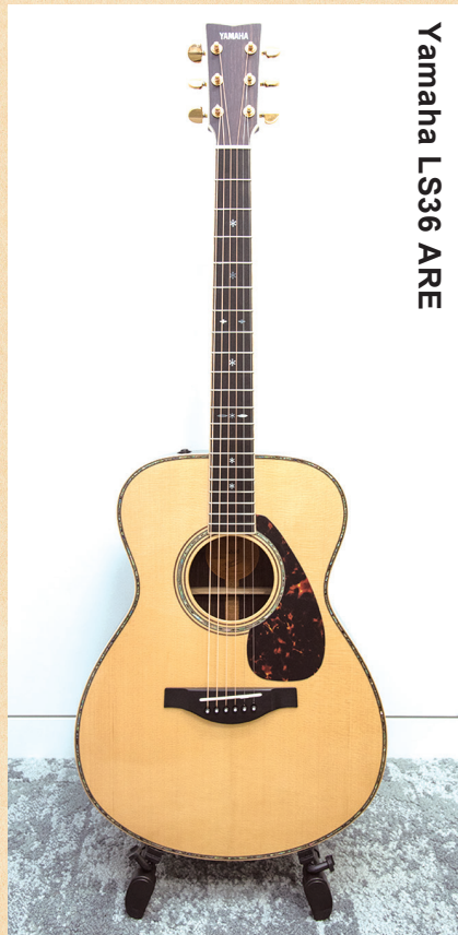
Yamaha LS36 ARE

◀オリジナルのスモールボディで、ヤマハ独自の木材改質技術「A.R.E.」を採用することで音の伝達と振動効率を上げ、熟成された味わい深い響きを獲得。ネックは高い演奏性を実現する新形状を採用している。