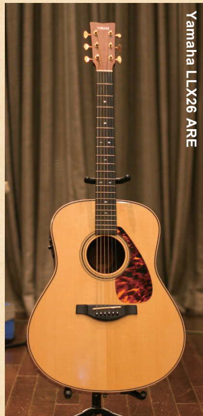
Yamaha LLX26 ARE

◀独自の木材改質技術「A.R.E.」を採用することで音の伝達と振動効率を上げ、熟成された味わい深い響きを獲得。ピックアップシステムはシステム60で、ブリッジ付近に仕込まれた3つのピックアップによって緻密な音作りが可能。