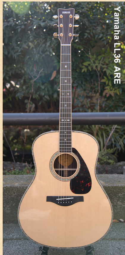
Yamaha LL36 ARE

◀ヤマハ独自の木材改質技術「A.R.E.」を採用することで音の伝達と振動効率を上げ、熟成された味わい深い響きを獲得。ミニフィアムジャンボボディで、抜群のレスポンスを備えている。