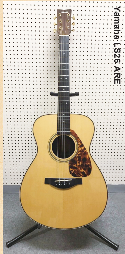
Yamaha LS26 ARE

◀オリジナルのスモールボディで、独自の木材改質技術「A.R.E.」を採用することで音の伝達と振動効率を上げ、熟成された味わい深い響きを獲得。ネックは高い演奏性を実現する新形状を採用している。