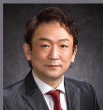
指揮・演出 細岡雅哉