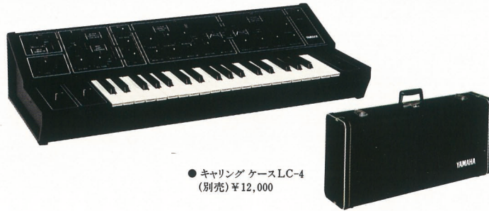
●キャリングケースLC-4 (別売) ¥12,000

アマチュアにも使い易い、操作性を重視した設計のCSシリーズ・スタンダードモデル。オーディオシステムにも組みこめて、多重録音によるオーケストレーションも可能。コンパクトでスペースをとらないため、セカンドキーボードとしても最適。他のキーボードの上にラクにセットできます。といった具合に個性的に使えるパーソナルタイプ。用途を問わないフレキシビリティが自慢です。