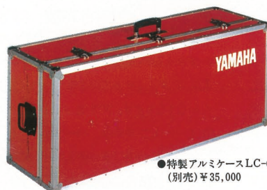
●特製アルミケースLC-6 (別売) ¥35,000