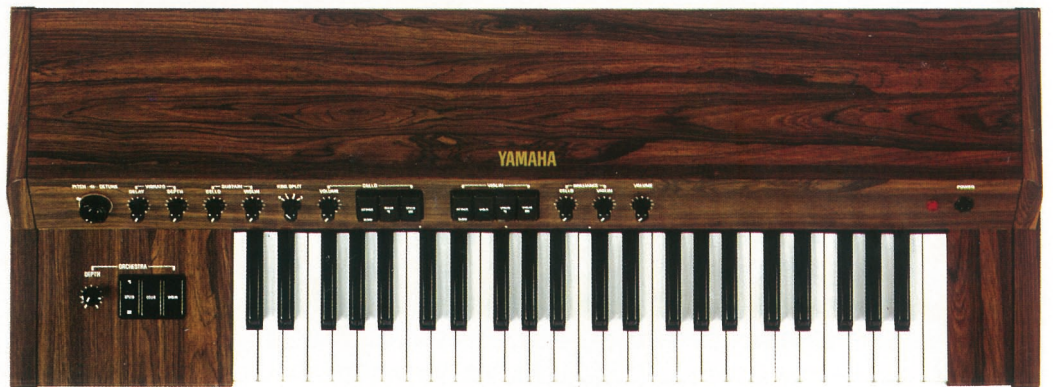
●上ストリングスSS-30 下エレクトロニックピアノ/CP-20

バイオリン&ビオラ系、セロ系の2系列、5種類の音色をもつ音域4オクターブのストリングスキーボード。もちろんコード演奏ができるポリフォニックタイプです。音の立ち上がりを変化させ、擦弦楽器の特長を捕えるアタックコントロール。鍵盤の高域と低域を別々の音色にセット、室内楽的表現の可能なキートンズプリット。大編成オーケストレーションの雰囲気をつくるオーケストラスイッチなど、演奏にリアリティをもたせるコントロール類を満載しています。セカンドキーボードとしての使い方を考慮。大型キーボードの上にセットしても充分な演奏性を保つため鍵盤は傾斜式。プロフェッショナルのための、新しいタイプのキーボードです。