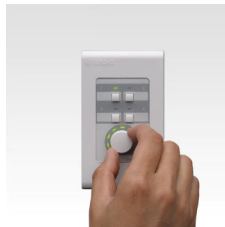
デジタルコントロールパネル DCP1V4S-US