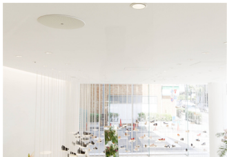
シーリングスピーカー VXC2FW