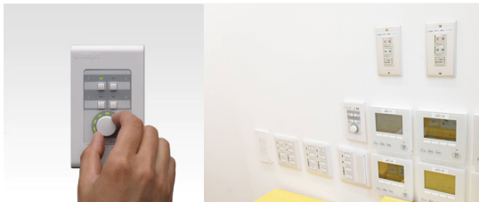
デジタルコントロールパネル DCP1V4S-US