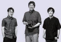
YH-5000SE / Engineers

“夜な夜なヘッドホンに引き寄せられ、時間を忘れて音楽に没頭する”、そんな音楽体験の究極を追求して、YH-5000SEは、音・装着性・ビルドクオリティ・デザインのあらゆる面に於いて徹底的にこだわってきました。ぜひ私たちが作り上げたこのヘッドホンで、音聴いていた曲、今夢中になっている曲、これから出会う曲を心ゆくまで自由に行き来してみてください。