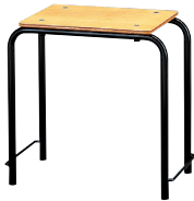
学校用オルガン専用椅子 SCS-2

●キーボードとモニタースピーカーを専用ネジで固定でき、ロック付きキャスターで移動にも便利です。