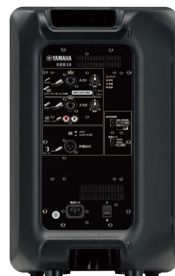
リアパネル操作部