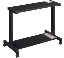
学校用キーボードスタンド L-S300 推奨