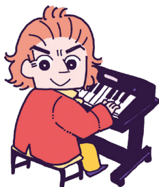
イラスト: やまみちゆか

別売のスタンド (L-S300)、スピーカー (SBR10)、フットコントローラー (FC7) を組み合わせてSEK-300をオルガンスタイルに。