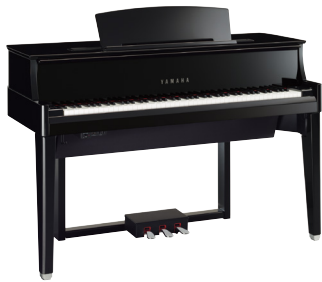
ヤマハアバングランド (ハイブリッドピアノ) N1X