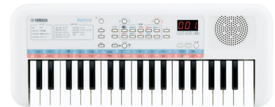
ヤマハミニキーボード