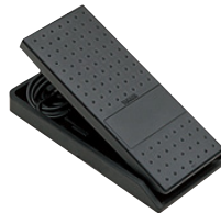
フットコントローラー FC7