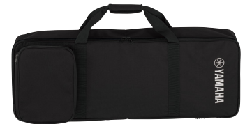
ヤマハハーモニーディレクター ソフトケース SC-HD300