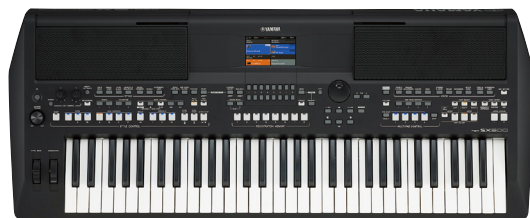
ヤマハポータブルキーボード (電子キーボード)