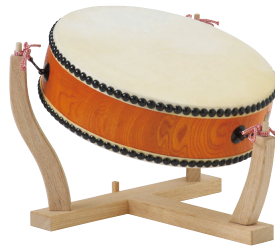
平太鼓・樺 HRD130 座台 HRDD130