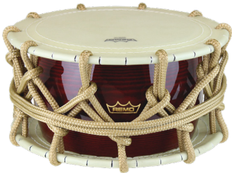
レモ ロープ締太鼓 JS07103T 推奨 価格/¥220,000 (税込)