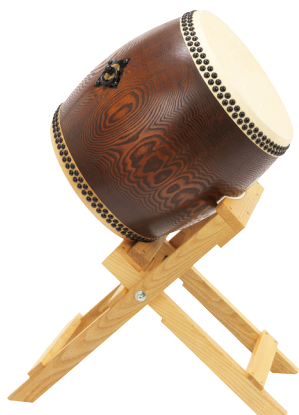
長胴太鼓・ふきうるし調栓 NDFS140 折りたたみ台 OTD130