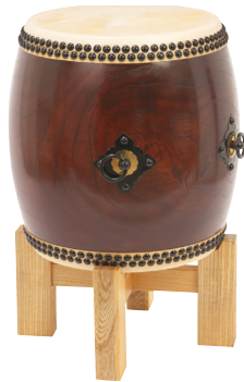
長胴太鼓・ふきうし調樫 NDFK130 平置十字台 HJD130