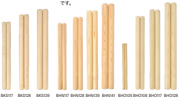
BKS117 BKS128 BKS139 BHN117 BHN128 BHN139 BHN141 BHO105 BHO106 BHO117 BHO128