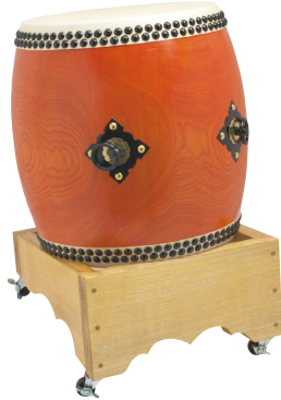
長胴太鼓・栓 NDDS130 平置台 NOHDC130