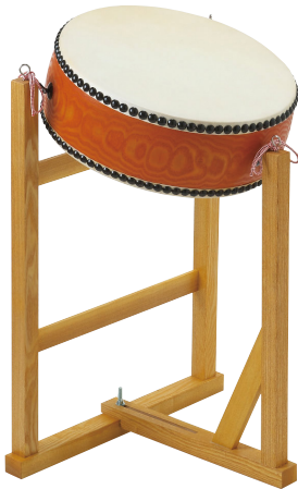
平太鼓・樺 HRD140 立奏台 HRRD