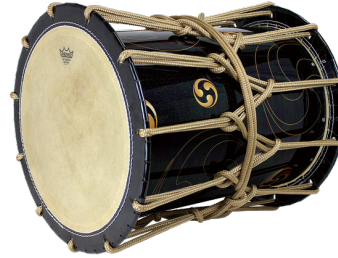
レモ かつぎ桶太鼓 JO152172