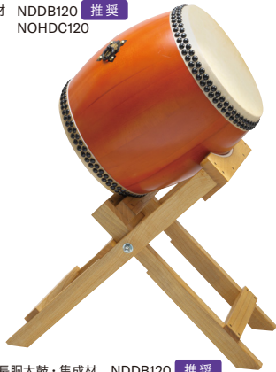
長胴太鼓・集成材 折りたたみ台 NDDDB120 推奨 OTD110