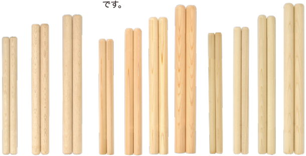
BKS117 BKS128 BKS139 BHN117 BHN128 BHN139 BHN141 BHO105 BHO106 BHO117 BHO128