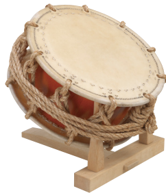
附締太鼓・集成材(ブナ材) TSDB100 推奨 附締太鼓用立奏台 TSDD700 推奨