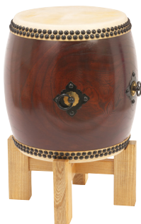
長胴太鼓・ふきうるし調樺 平置十字台 NDFK130 HJD130