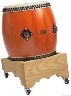
長胴太鼓・集成材 平置台 NDDDB120 推奨 NOHDC120