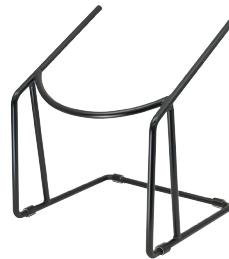
締太鼓用座台 TSDD500 推奨