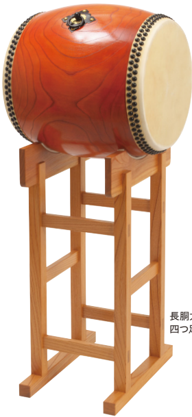
長胴太鼓・樺 四つ足台 NDDK160 4LD160