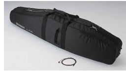
SVC50 のソフトケースと付属品