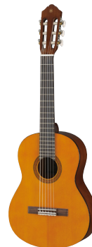
ヤマハクラシックギター