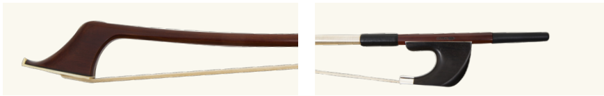
アルファ・ワン コントラバス用弓