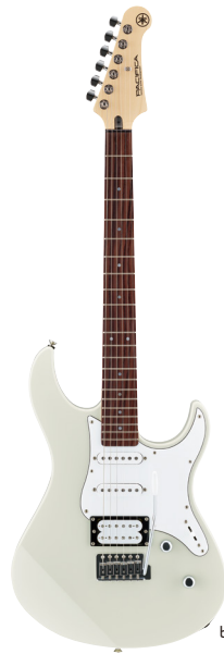
ビンテージホワイト (VW)