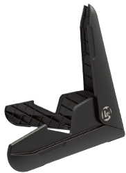
ギタースタンドエレキ用 (黒) GS0100

価格/¥6,050 (税込) ●コンパクトに折りたたみ可能 ●折りたたみサイズ/320×153×31mm