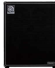
アンペグ スピーカーキャビネット