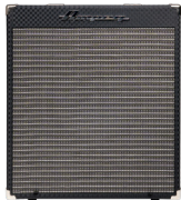
アンペグ ベースコンボアンプ