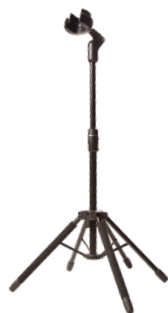
スターフィッシュプラス SS0102

価格/¥17,600 (税込) ●1本掛けスタンド ●5本脚で抜群の安定性 ●ヘッドには重力作動式のロックシステムを採用(パネル付き)