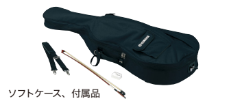
ソフトケース、付属品