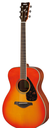
オータムバースト (AB)