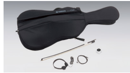
SVC110S のソフトケースと付属品