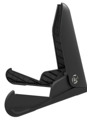
ギタースタンドアコギ用 (黒) GS0200

価格/¥6,050 (税込) ●コンパクトに折りたたみ可能 ●折りたたみサイズ/320×153×31mm