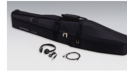
SVC210 のソフトケースと付属品