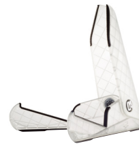
アイススタンドアコギ用 (クリア) GS0203

価格/¥6,050 (税込) ●コンパクトに折りたたみ可能 ●折りたたみサイズ/320×153×31mm