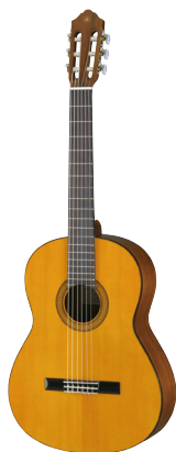
ヤマハクラシックギター