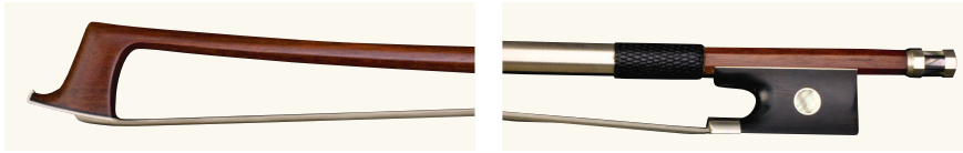
アルファ・ワン バイオリン用弓

良質な材料を使用し、国内の弦楽器製作家の厳しい目で選定された高品質な弓です。優れたテンションを有しており、初級者には弾きやすく、上級者にはさまざまな奏法を実現できる品質が魅力です。