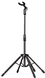
スターフィッシュ SS0100