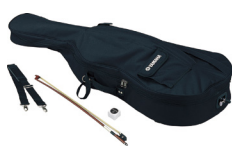
ソフトケース、付属品