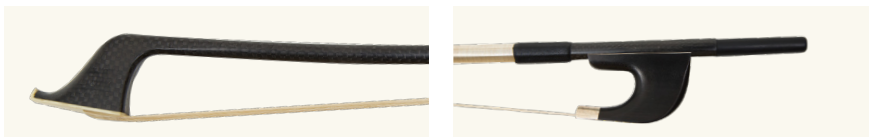
アルファ・ワン コントラバス用カーボン弓