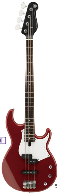
BB234 ラズベリーレッド (RBR)