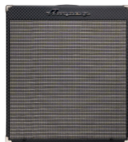
アンペグ ベースコンボアンプ