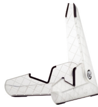
アイススタンドエレキ用 (クリア) GS0103

価格/¥6,600 (税込) ●コンパクトに折りたたみ可能 ●折りたたみサイズ/350×165×39mm