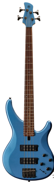
TRBX304 ファクトリーブルー (FTB)