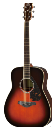
タバコブラウンサンバースト (TBS)