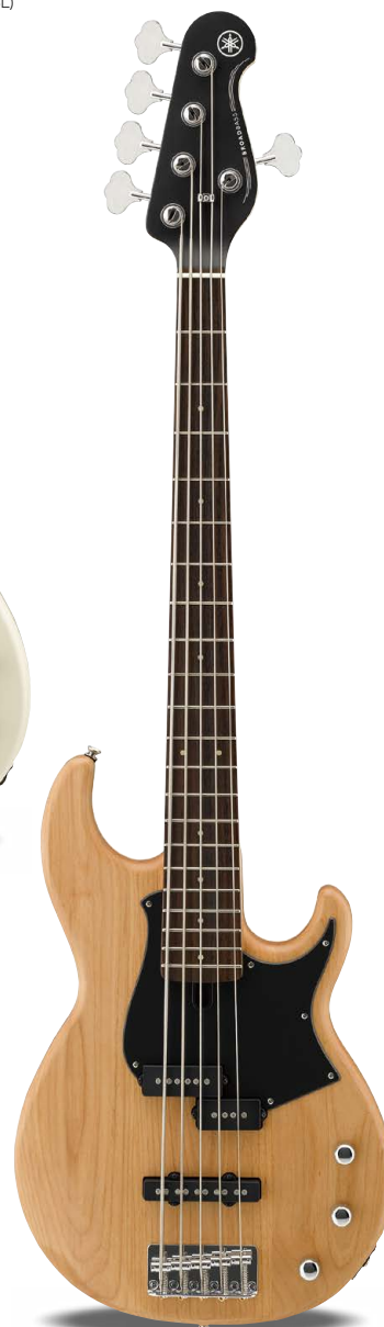
BB235 YNS (イエローナチュラルサテン)