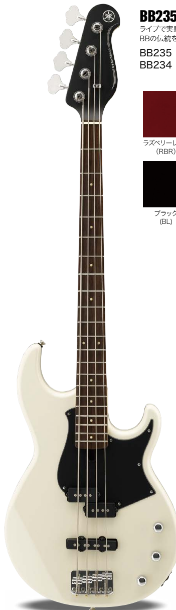
BB234 VW (ビンテージホワイト)