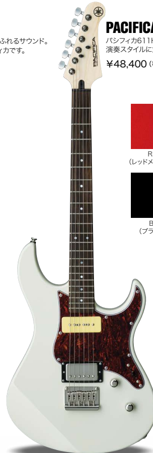
VV (ピンテージホワイト)