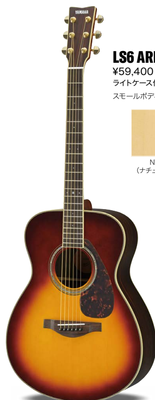
BS (ブラウンサンバースト)