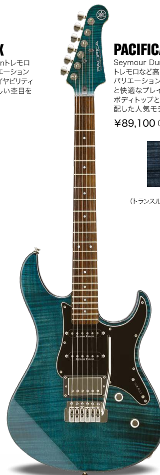
IDB (インディゴブルー)

2タイプのピックアップが生み出す個性あふれるサウンド。カスタムパーツを搭載した個性派パシフィカです。ブリッジにはWilkinson社製VS-50を搭載し、スムーズなアーミングを実現しました。