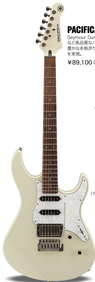
VV (ピンテージホワイト)

Seymour Duncan PUやWilkinsonトレモロなど高品質なパーツを搭載し、バリエーション豊かな本格派サウンドと快適なプレイヤビリティを実現。ボディトップとヘッドに美しい杢目を配した人気モデル。