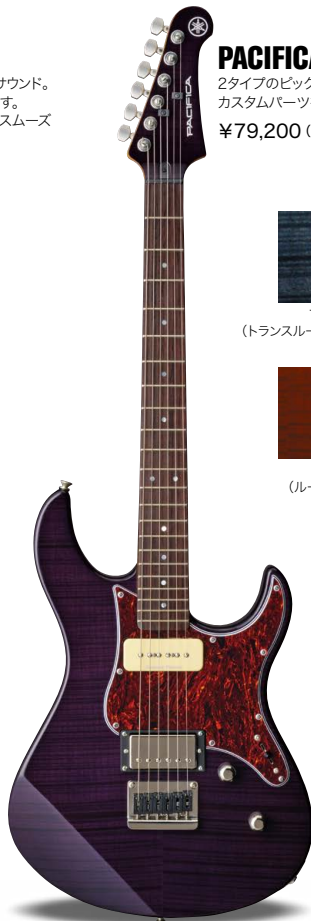
TPP (トランスルーセントパープル)