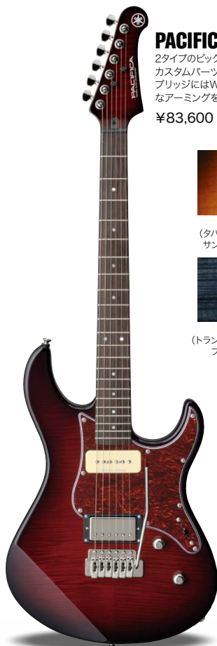
DRB (ダークレッドバースト)

2タイプのピックアップが生み出す個性あふれるサウンド。カスタムパーツを搭載した個性派パシフィカです。