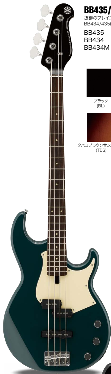
BB434 TB (ティールブルー)