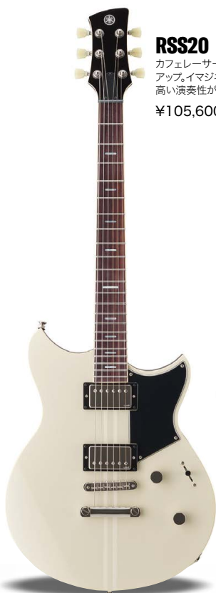
VW (ビンテージホワイト)