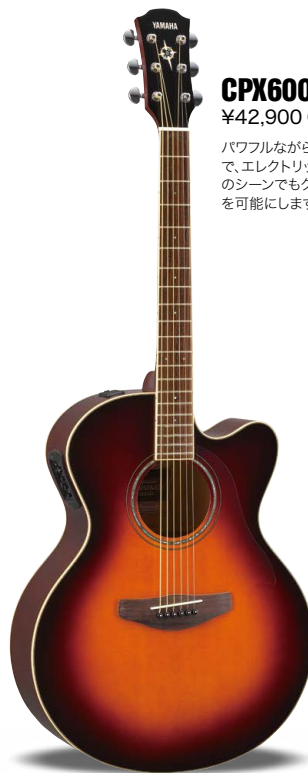
OVS (オールドバイオリンサンバースト)

エレクトリック・アコースティック・ギターとしてのサウンドや演奏性を考慮したデザインを実現。そのプレイングも、レスポンスに優れたダイナミックなサウンドにポイントが置かれ、くびれが深いデザインにカットウェイを施し、座奏時の演奏性を高めています。