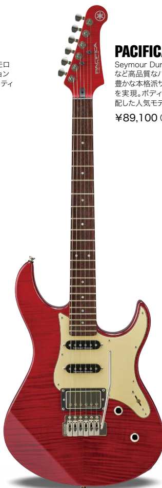
FRD (ファイヤードレッド)

Seymour Duncan PUやWilkinsonトレモロなど高品質なパーツを搭載し、バリエーション豊かな本格派サウンドと快適なプレイヤビリティを実現。ボディトップとヘッドに美しい杢目を配した人気モデル。