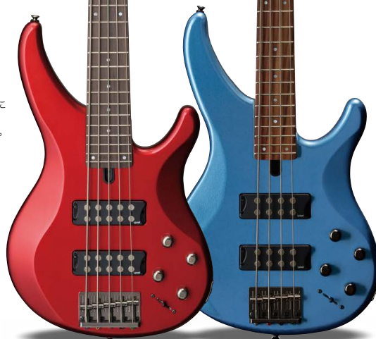
TRBX305 CAR (キャンディアップルレッド)