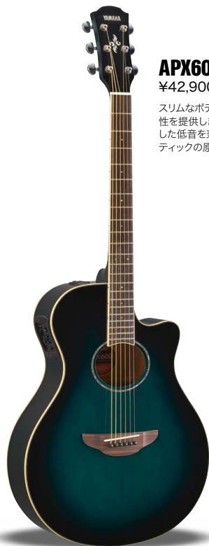
OBB (オリエンタルブルーバースト)

バックのサウンドに埋もれない、「アコースティックギターサウンド」でのリードプレイを可能にする、中高音のハリと強さを強調したサウンド設計が成されています。さらに演奏性を追求した薄胴ボディ&カットウェイ、エクストラフレットなど、エレキギターからの持ち替えもスムーズなデザイン。リアルなアコースティックギターの響きはもちろん、さまざまな鳴りやトーンを表現できるエレクトリック・アコースティックギターです。