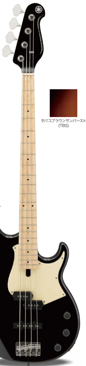
BB434M BL (ブラック)