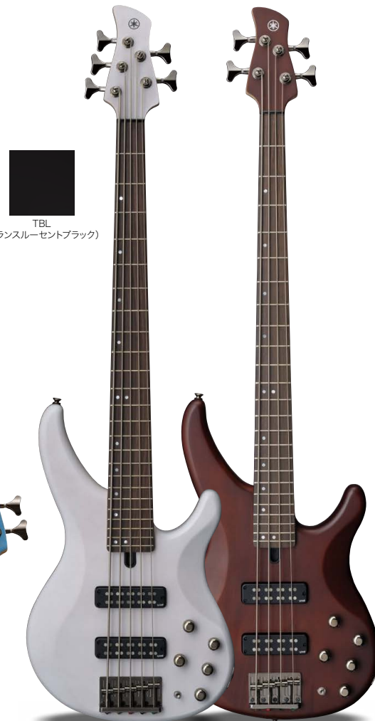
TRBX505 TWH (トランスルーセントホワイト)