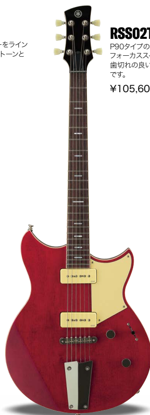
FRD (ファイヤードレッド)