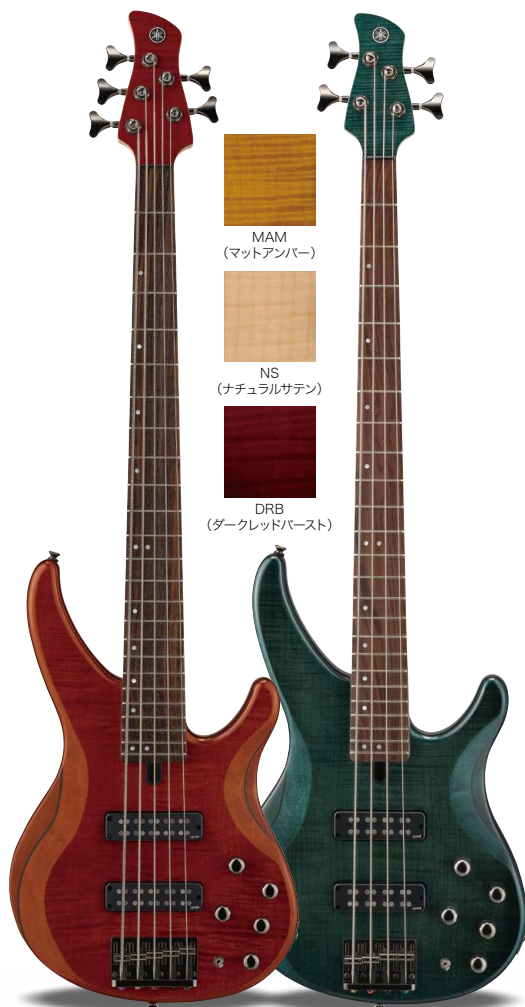
TRBX605FM CMB (キャメルブラウン)