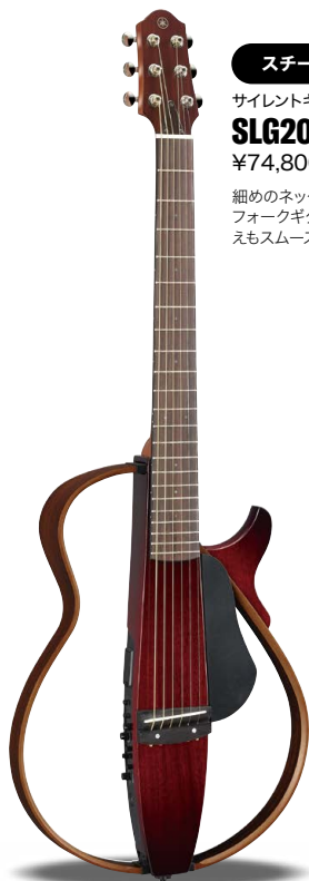
CRB (クリムゾンレッドバースト)