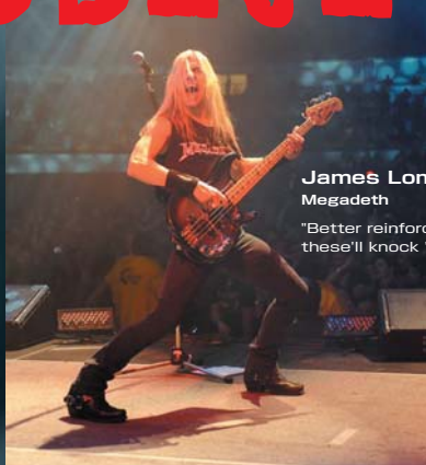
James Lomenzo Megadeth "Better reinforce the walls, these'll knock 'em over!"