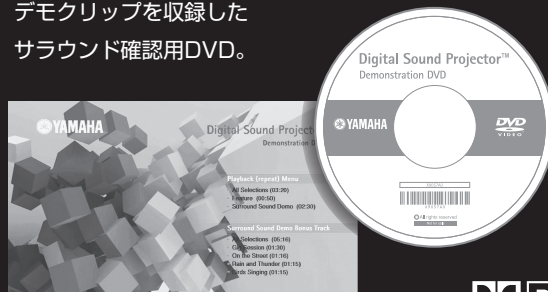
サラウンド確認用DVD：メニュー画面

デジタル・サウンド・プロジェクターの説明や サウンドチェックが可能なビデオ映像の デモクリップを収録した サラウンド確認用DVD。