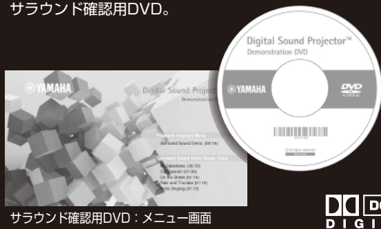
サラウンド確認用DVD：メニュー画面

サウンドチェックが可能なビデオ映像の デモクリップを収録した サラウンド確認用DVD。