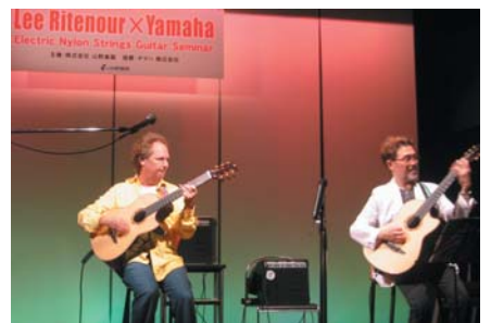
東京のクリニックでは、スペシャルゲストにギタリスト渡辺香津美氏が駆けつけ、30年ぶりの共演となった。