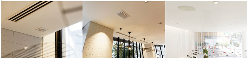
スピーカーシステム VXS1MLW (別売金具 CMA1MLW 使用)