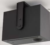
サブウーファー VXS10S (別売金具 UB-DXR8 使用)