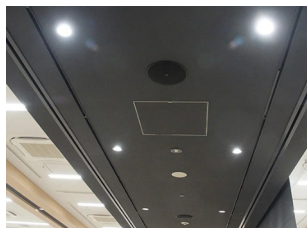
シーリングスピーカー VXC6