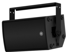
スピーカーシステム CZR10 (別売金具 UB-DZR10H 使用)