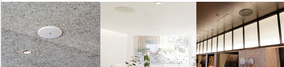
シーリングスピーカー VXC4W