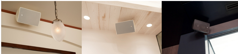
サーフェスマウントスピーカー VX5W