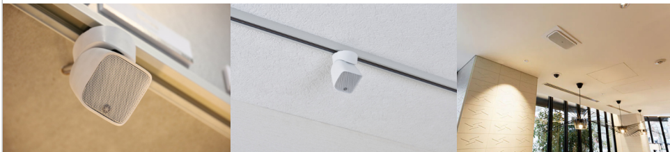
スピーカーシステム VXS1MLW (別売金具 RMA1MB 使用)